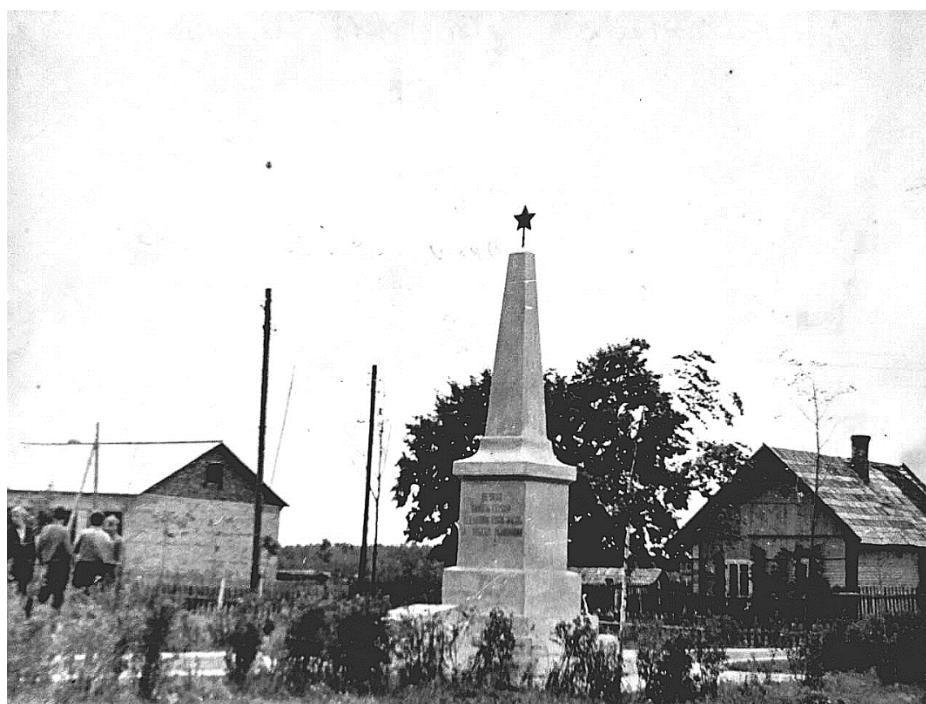
Быстрица (примерно 1967 год)